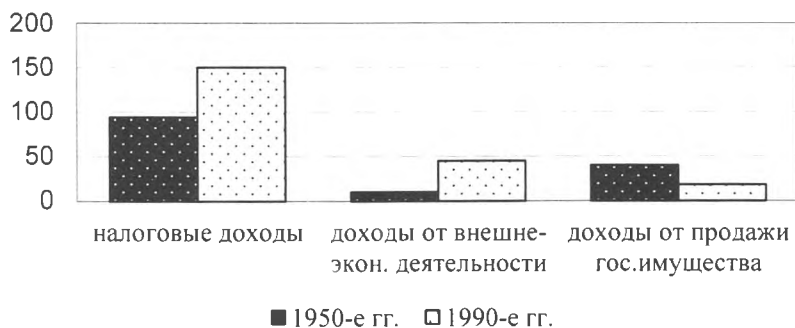
Статьи доходов в бюджете страны N.