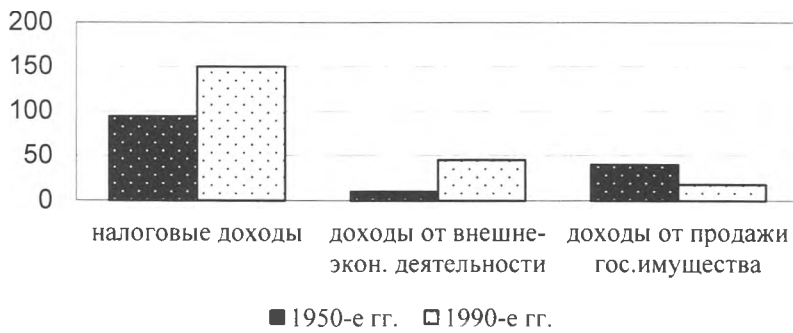
Статьи доходов в бюджете страны N.